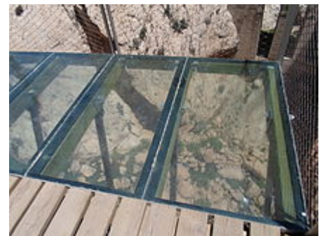
Balcón acristalado del nuevo caminito del rey.

proyecto para su reparación, 7 con un presupuesto de €5 millones de euros. 8 Las obras comenzaron en 2014 y duraron aproximadamente un año.