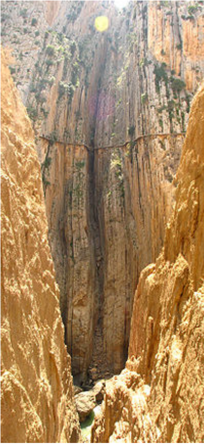
Vista frontal del Caminito.

camino, Benjumea decidió mejorarlo y reformar el puente entre los dos lados del desfiladero. Estas dos paredes rocosas unidas por el denominado Balconcillo de los Gaitanes son de las más famosas de la provincia. En 1921 el rey Alfonso XIII presidió la inauguración de los Embalses Guadalhorce-Guadaleba, cruzando para ello el camino previamente construido, o al menos lo visitó. Desde entonces, se le empezó a llamar Caminito del Rey .