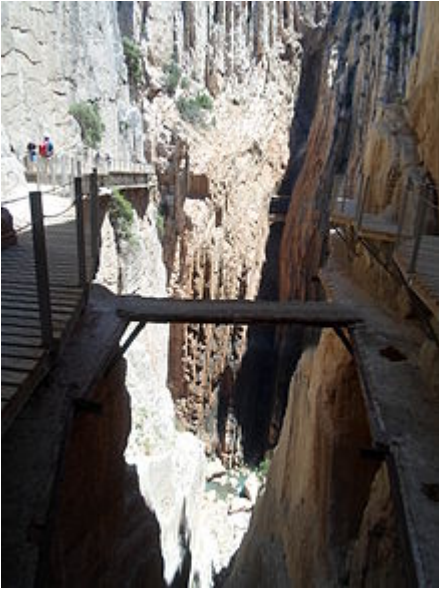
Vista con el caminito del rey viejo y el nuevo.

También se puede llegar desde Málaga hasta la estación de El Chorro-Caminito del Rey con los servicios de la línea 67 de Media Distancia de Renfe, que suele tardar entre 45 minutos y 1 hora.